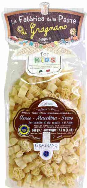
Машинки 500 г