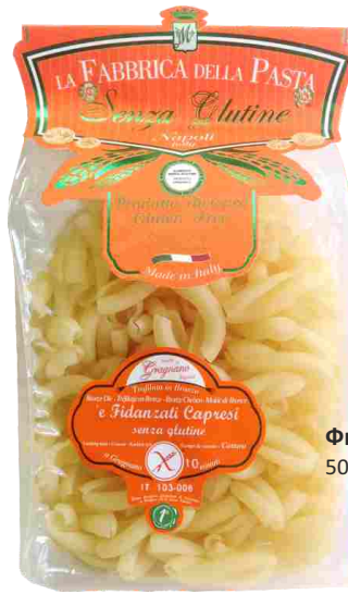
Фиданцати 500 г