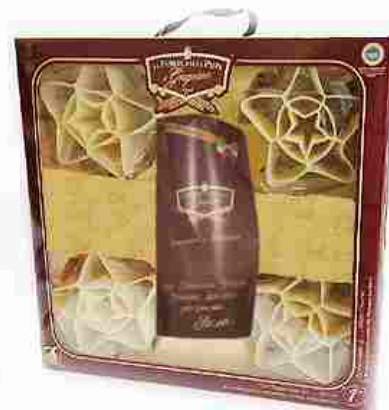
ЗВЕЗДА БОЛЬШАЯ Индивидуальная упаковка 1 шт