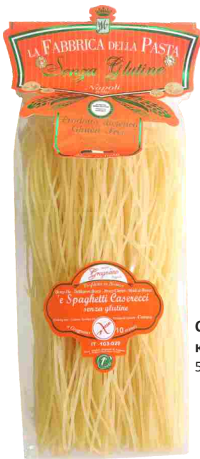
Спагетти казеречче 500 г