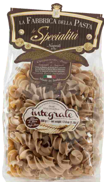
Паста Фузиллони из цельнозерновой муки 500 г