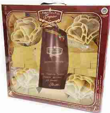
СЕРДЕЧКИ БОЛЬШИЕ Индивидуальная упаковка 1 шт