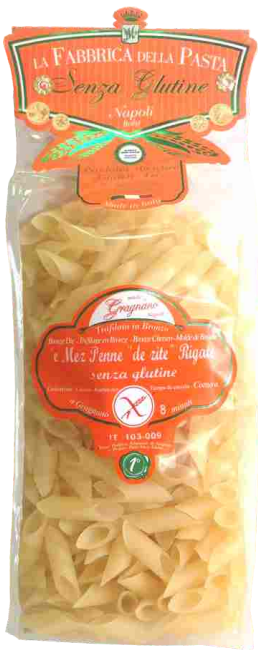
Пенне рифленые короткие 500 г