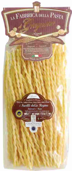
Фузилли рифленные ручной работы 500 г