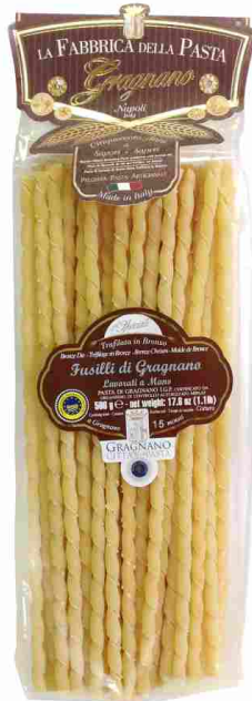
Фузилли ручной работы 500 г