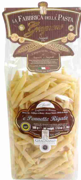
Пеннетте рифленные 500 г