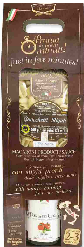
с соусом с БАЗИЛИКОМ