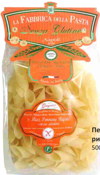
Пеннони рифленые 500 г