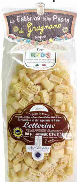
Алфавит 500 г