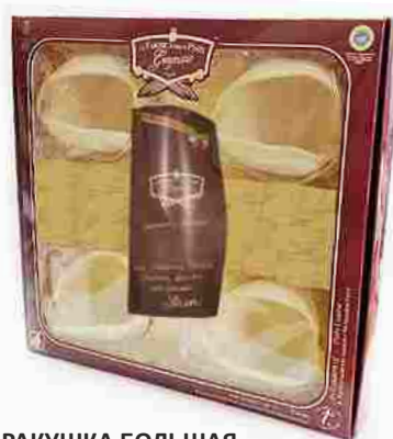
РАКУШКА БОЛЬШАЯ Индивидуальная упаковка 1 шт