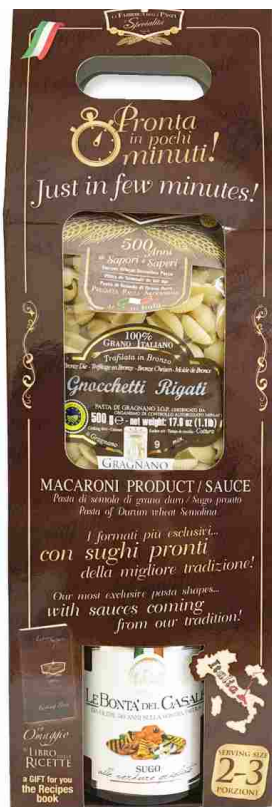
с соусом из ОВОЩЕЙ-ГРИЛЬ