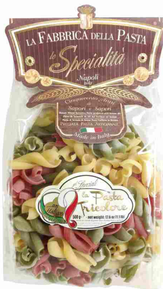
Фиданцати триколор 500 г