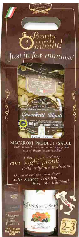
с соусом ПУТТАНЕСКА