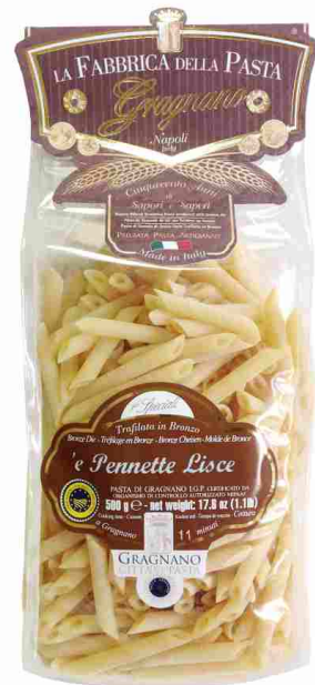
Пеннетте 500 г