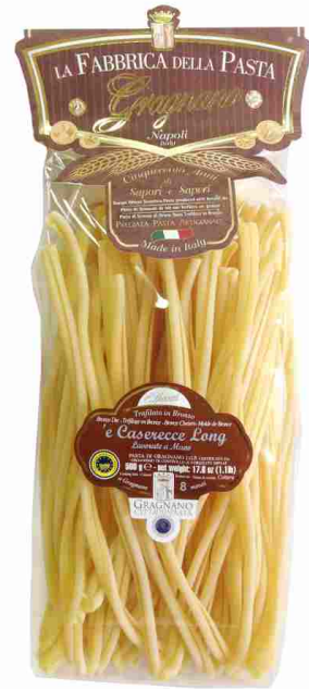
Казерече длинная ручной работы 500 г