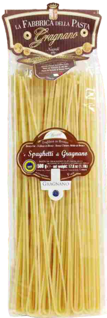
Спагетти Граньяно 500 г