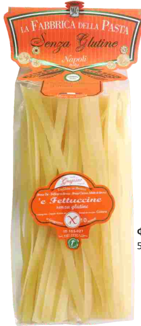
Феттуччине 500 г