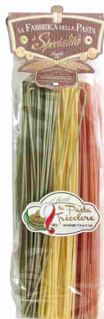
Спагетти триколор 500 г