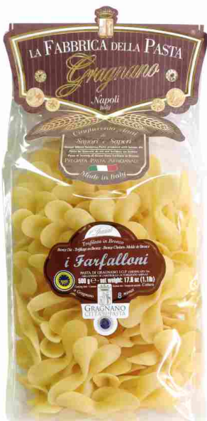
Бабочки 500 г