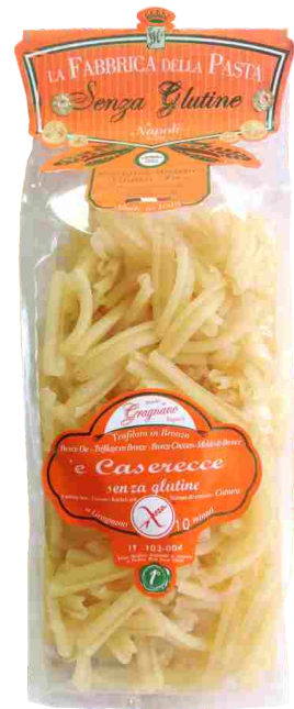
Казеречче 500 г