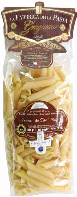
Пенне 500 г