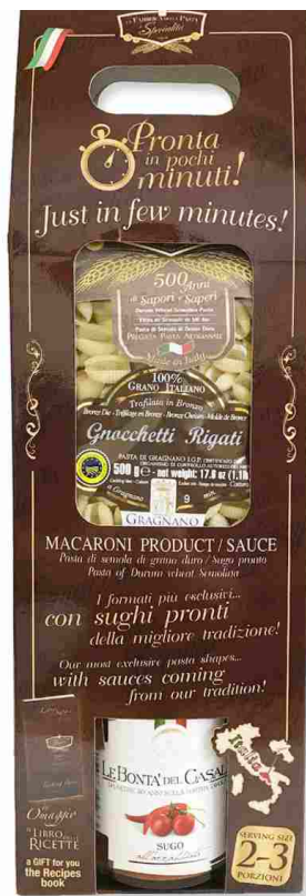
с острым соусом АЛЬ'АРРАББЬЯТА