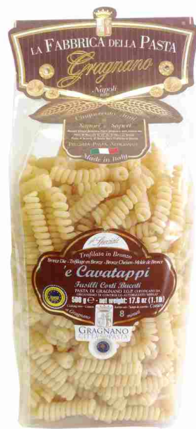
Пружинки 500 г