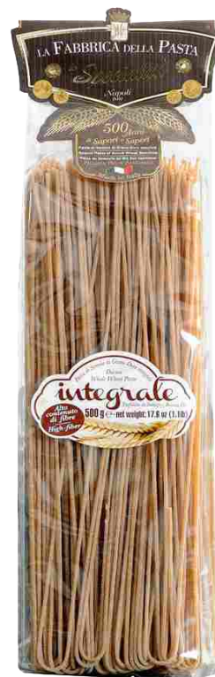
Паста Спагетти из цельнозерновой муки 500 г