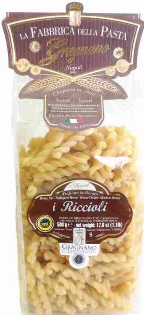
Спиральки 500 г