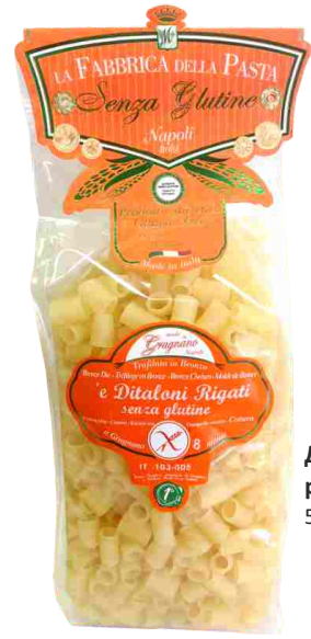
Диталони рифленые 500 г