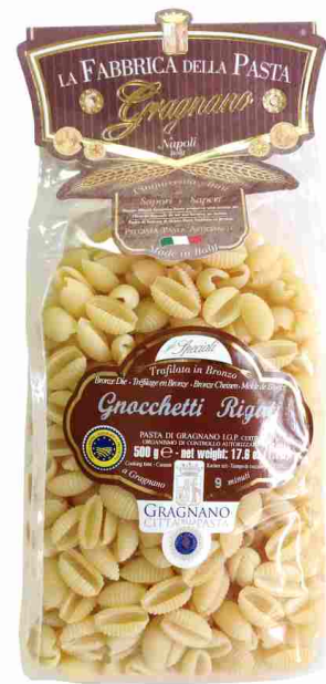
Ньокетти рифленные 500 г