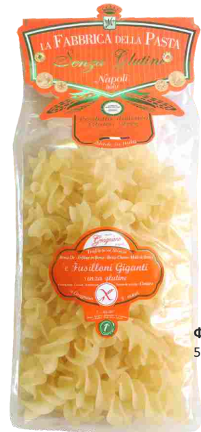
Фузиллони 500 г