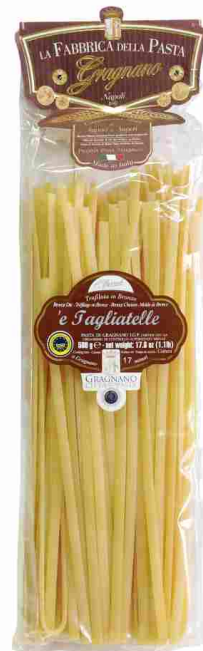
Тальятелле 500 г