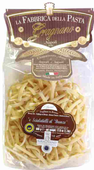
Шиалательле на бронзовой фильере 500 г