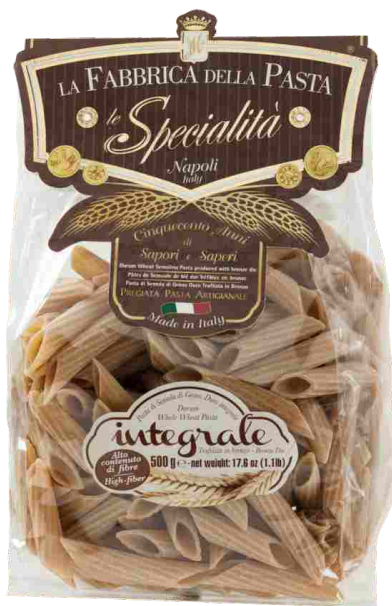
Паста Пенне рифленые из цельнозерновой муки 500 г