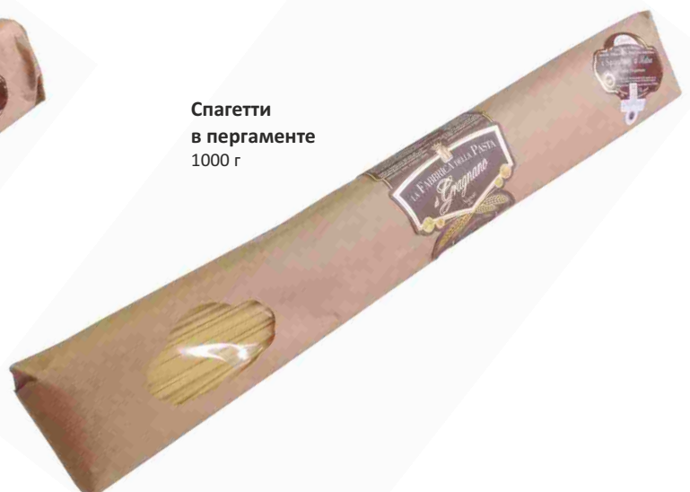
Спагетти в пергаменте 1000 г