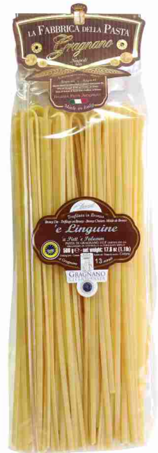
Лингвине 500 г