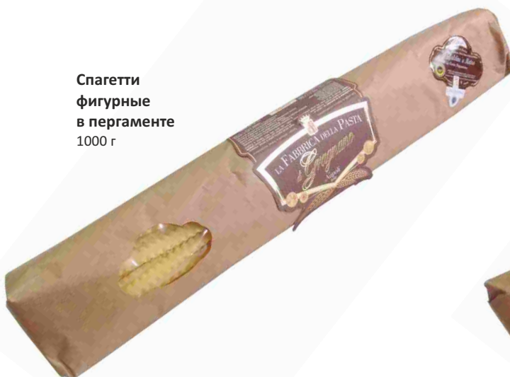
Спагетти фигурные в пергаменте 1000 г