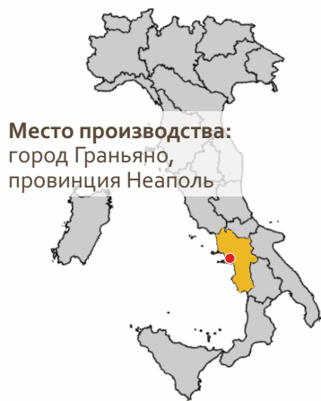
Место производства: город Граньяно, провинция Неаполь