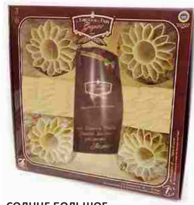
СОЛНЦЕ БОЛЬШОЕ Индивидуальная упаковка 1 шт