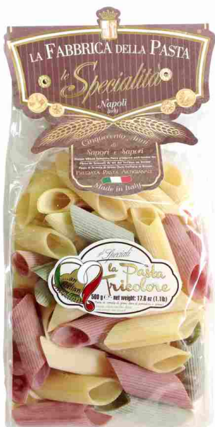
Ригатони триколор 500 г