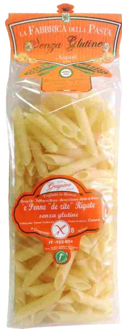
Пенне рифленые 500 г