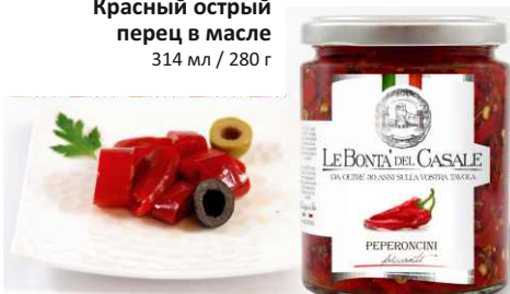
Красный острый перец в масле 314 мл / 280 г