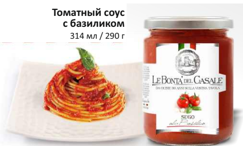
Томатный соус с базиликом 314 мл / 290 г