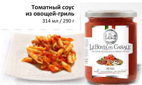
Томатный соус из овощей-гриль 314 мл / 290 г