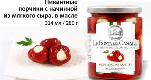
Пикантные перчики с начинкой из мягкого сыра, в масле 314 мл / 280 г