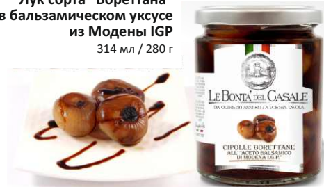
Лук сорта "Бореттана" в бальзамическом уксусе из Модены IGP 314 мл / 280 г