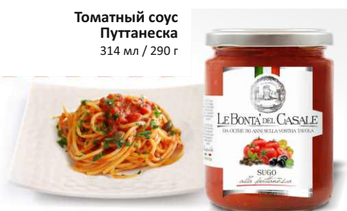
Томатный соус Путтанеска 314 мл / 290 г