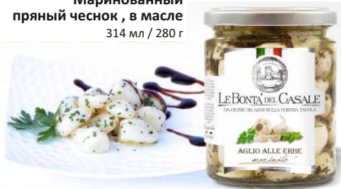
Маринованный пряный чеснок , в масле 314 мл / 280 г