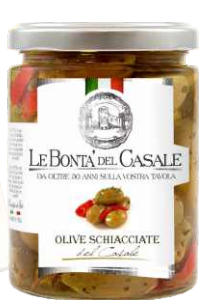
Оливки сорта «Леччино» без косточки, в масле 314 мл / 280 г