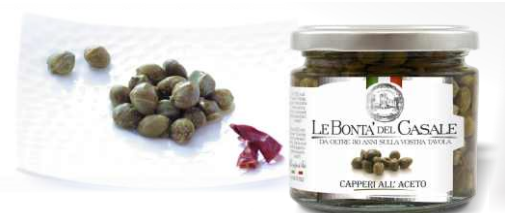
Каперсы в винном уксусе 212 мл / 180 г