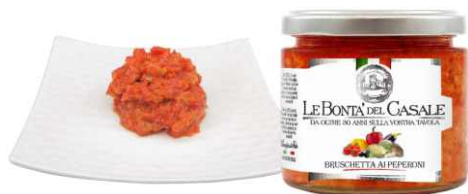
Брускетта из перцев 212 мл / 180 г