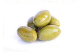
Оливки сорта «Белла ди Чериньола», в рассоле 314 мл / 280 г