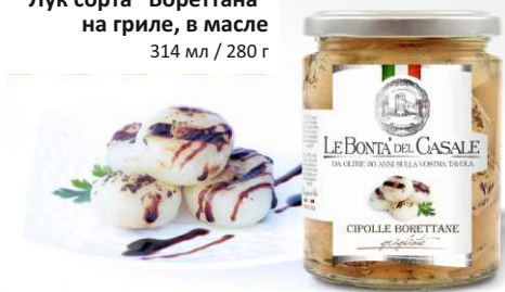
Лук сорта "Бореттана" на гриле, в масле 314 мл / 280 г