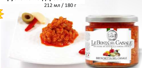
Брускетта по-деревенски 212 мл / 180 г