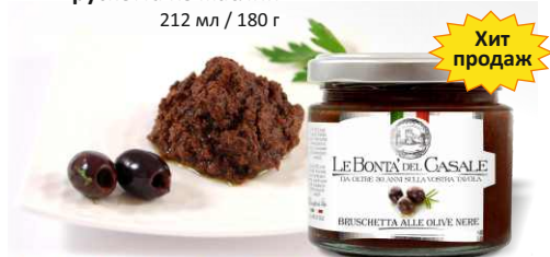
Брускетта из маслин 212 мл / 180 г