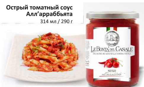
Острый томатный соус Алл'арраббьята 314 мл / 290 г