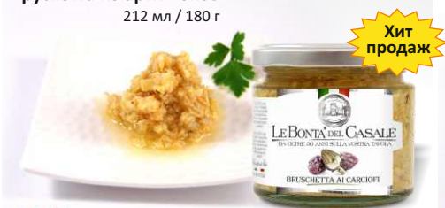
Брускетта из артишоков 212 мл / 180 г