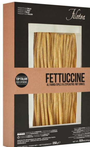
Феттучине 250г из полбяной муки