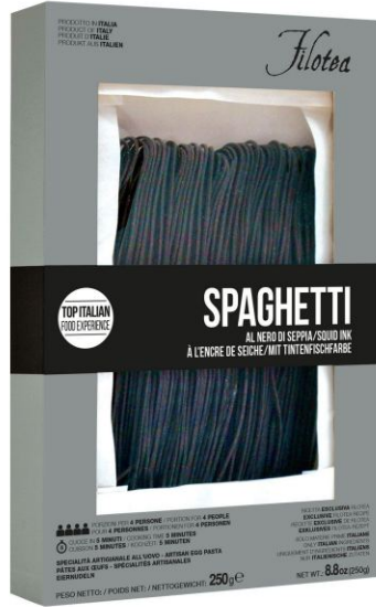
Спагетти Китарра с чернилами каракатицы 250г