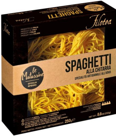
Матассине Спагетти 250г Китарра ручной работы