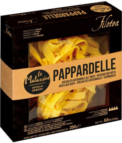
Матассине Паппарделле 250г ручной работы