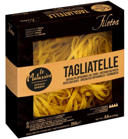
Матассине Тальятелле 250г ручной работы