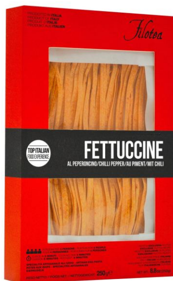
Феттучине с острым перцем 250г