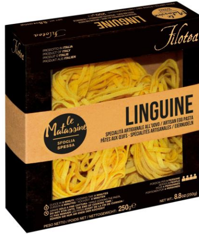
Матассине Лингвине 250г ручной работы