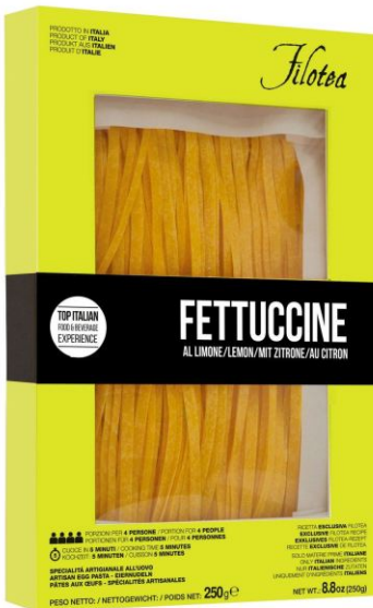
Феттучине с лимоном 250г