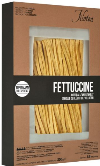
Феттучине 250г из цельнозерновой муки