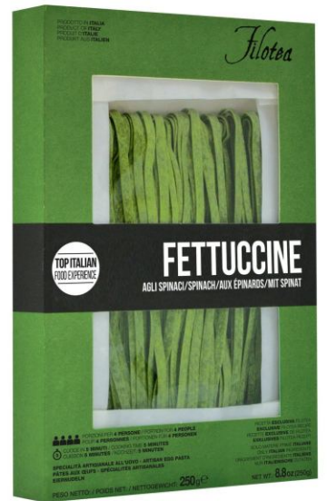
Феттучине со шпинатом 250г