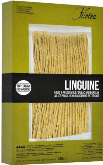
Лингвине с чесноком 250г и петрушкой